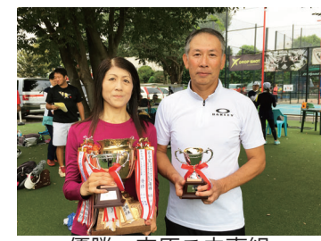
優勝 安原ご夫妻組