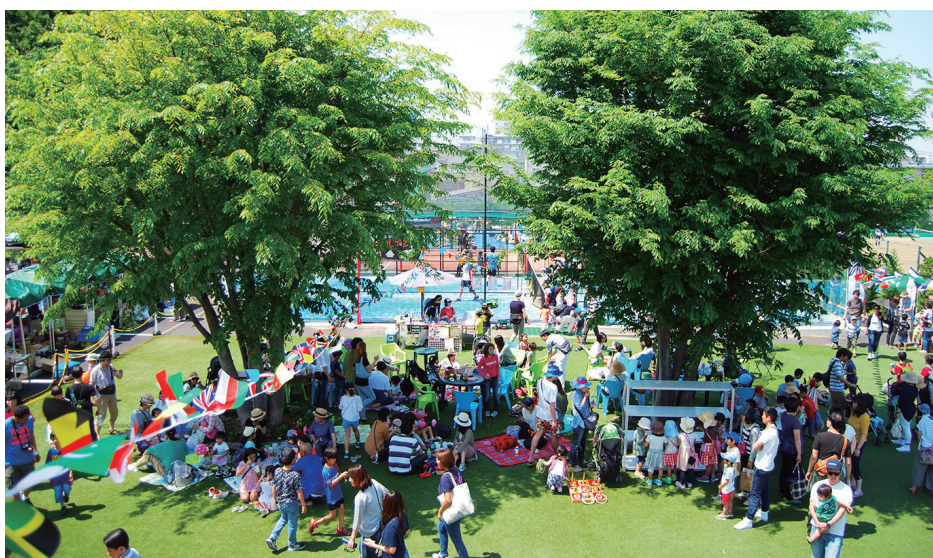
平成31(2019)年のふれあい祭り