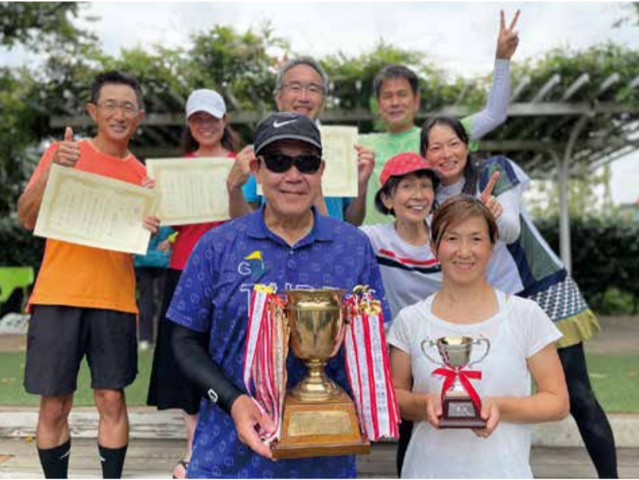
入賞したみなさん